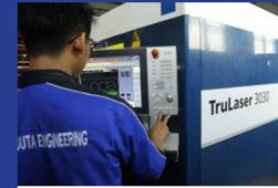
Trudisc 3030 Fiber