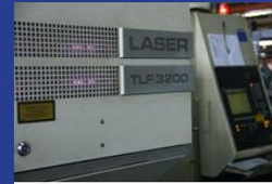
Laser 3030 CO

PT. ATMI Duta Engineering Solo berdiri juga sebagai sarana pendukung pelaksanaan pendidikan berbasis produksi. Perusahaan ini dapat digunakan untuk bekerja bagi seorang engineer khususnya yang berasal dari Politeknik ATMI sekaligus menjadi tempat mengasah ketrampilan para Mahasiswa/i juga siswa-siswa di Sekolah Menengah Kejuruan Santo Mikael Surakarta. Sehingga PT. ATMI Duta Engineering Solo juga turut serta menjamin mutu lulusan sebagai engineer yang benar-benar siap bekerja di dunia industri.