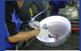
More capacity of welding